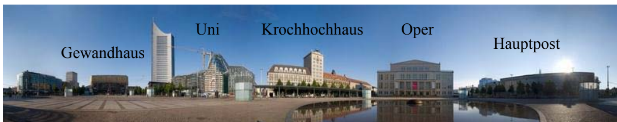
360°-Ansicht des Augustusplatz